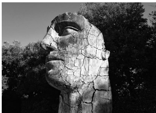
Igor Mitoraj: Tindaro Scropolato, Florenz.

Nach der Befreiung Italiens wird der Rechtsprofessor in die verfassungsgebende Versammlung gewählt, wo er von allen Seiten Respekt und Anerkennung erntet, weil er auf die andere Seite zugehen kann und nicht stur auf seinen Positionen beharrt. Nach einem Intermezzo als Staatssekretär in Rom schlägt seine Stunde, er wird zum Bürgermeister von Florenz gewählt. Sein ausserordentliches Engagement für die Armen war damals weitherum bekannt. Die Arnostadt war durch den Krieg stark getroffen: Alle Brücken ausser dem Ponte Vecchio waren gesprengt, viele Häuser hatten Schäden erlitten. Der neue-