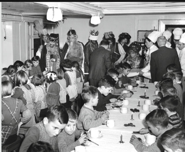
Bild: Dreikönigsfest im Kinderheim Steig, 1961

Der Kanton Appenzell Innerrhoden hat sich bei den ehemaligen Bewohnern des früheren Kinderheims Steig in Appenzell entschuldigt. Ein Bericht dokumentiert, dass Armut und Gewalt das Leben der Heimkinder prägten, die von Ingenbohrer Schwestern betreut wurden.